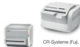
CR-Systeme (Fuji, Agfa)