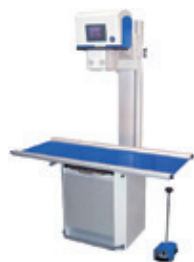
RAYVET-DR komplett integriertes DR-System